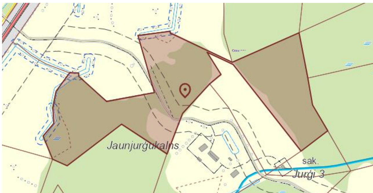
1.attēls. Zemes vienība ar kadastra apzīmējumu 42900040240